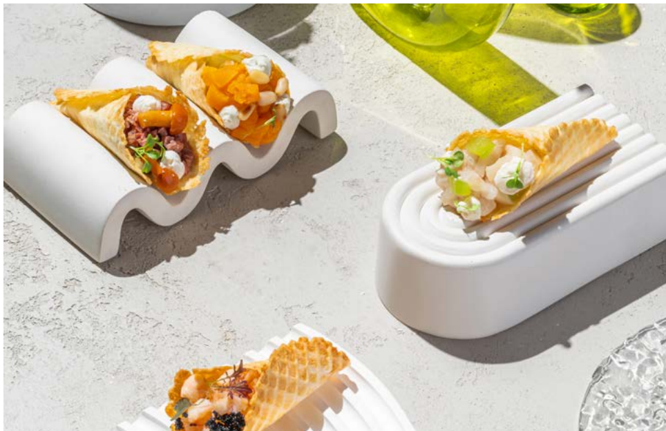
ФУРШЕТНОЕ ПРЕДЛОЖЕНИЕ ПОД ЛЮБОЙ БЮДЖЕТ